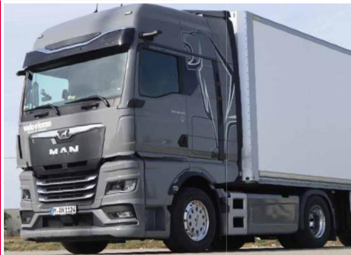
MAN TGX 18.520