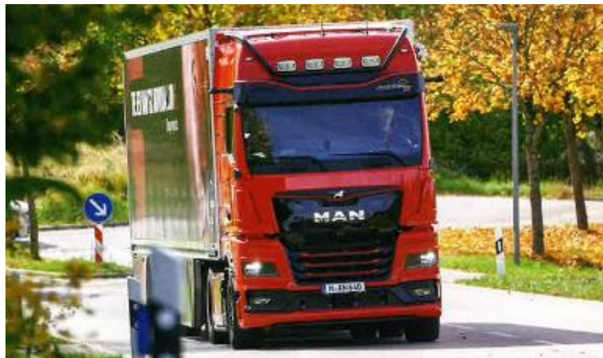
TGX 18.640 Individual „Münchner Prachtbursche“